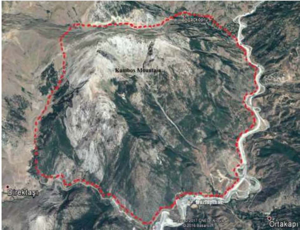
Şekil 1. Araştırma alanının coğrafi haritası (Anonim, 2017)

Araştırma alanımız Doğu Anadolu bölgesinde yer alan Bitlis ilinin il sınırları içerisinde yer almaktadır. Kambos Dağı kuzeydoğusunda Bitlis il merkezi, güneybatısında Direktaş Köyü, kuzeyinde Ağaçköprü Köyü, kuzeybatısında Mutki ilçesi, Güneydoğusunda Ağaçdere Köyü bulunur. İran-Turan Fitocoğrafik bölgesinde yer alan araştırma sahası, Türkiye florasındaki enlem ve boylamlara dayalı Grid Kareleme Sistemine göre B8 karesine girmektedir (Davis, 1965-1988). Güner vd., (2012) tarafından hazırlanan Türkiye Bitkileri Listesi Damarlı Bitkiler kitabında türlerin yayılışı için hazırlanan haritada 7 bölge ve 21 bölüm bulunmaktadır. Bu haritaya göre araştırma alanımız 5a-Yukarı Fırat Bölümü içerisinde yer almaktadır (Güner vd., 2012). Kambos Dağı Bitlis şehir merkezine yaklaşık 13 km uzaklıktadır. Araştırma alanının doğu ve güney sınırını Bitlis- Siirt karayolu çevrelemektedir. Araştırma alanı yaklaşık 15 km uzunluğunda ve yaklaşık 1300-2300 m arasında değişen yüksekliklere sahiptir. Araştırma alanımızın coğrafi haritası Şekil 1’de gösterilmiştir (Anonim, 2015). Çalışma alanında yerleşim yeri olarak sadece Ağaçköprü köyü bulunmaktadır (Kurşat ve Karataş, 2016).